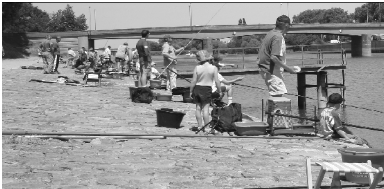
Tableau de présentation des différents Ateliers Pêche Nature prévus en 2010